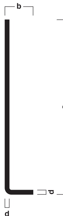
Abbildung zeigt das Sockelleistenprofil mit einer Abmessung von 80,0 x 13,0 mm und einer Profilstärke von 2,0 mm.

Ausschreibungstext, CAD-Detail, Montagehinweis Direktanwahl: www.alu-plan.de / EDAPA90